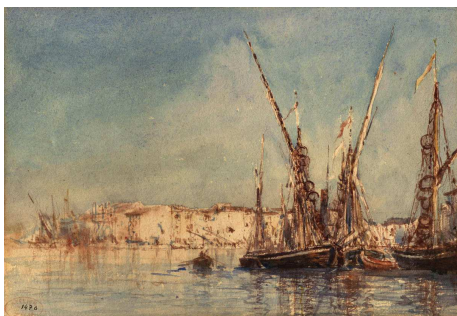
F. Ziem »Vue de Martigues«

Auf Nachfrage übermitteln wir Ihnen per Email druckfähige Bilddateien. Die als pdf-Datei beige-fügte Ausstellungsliste ist auch online auf unserer Website www.barbizon.de einsehbar.