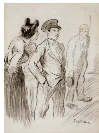
T.-A. Steinlen »Pariser Straßenszene«